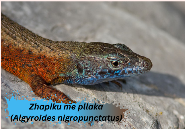
Zhapiku me pllaka ( Algyroides nigropunctatus )