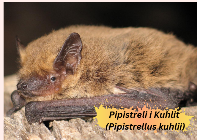
Pipistreli i Kuhlit ( Pipistrellus kuhlii )

Një aspekt i rëndësishëm i ishullit është gjithashtu biodiversiteti detar i përfaqësuar nga specie të tilla si leshteriku i detit, i cili formon një habitat të madh për riprodhimin e peshkut, prodhimin e oksigjenit dhe sekuestrimin e karbonit dhe specie si algat kafe ose algat e kuqe koraline.