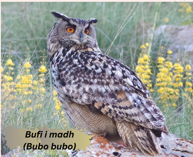
Bufi i madh ( Bubo bubo )