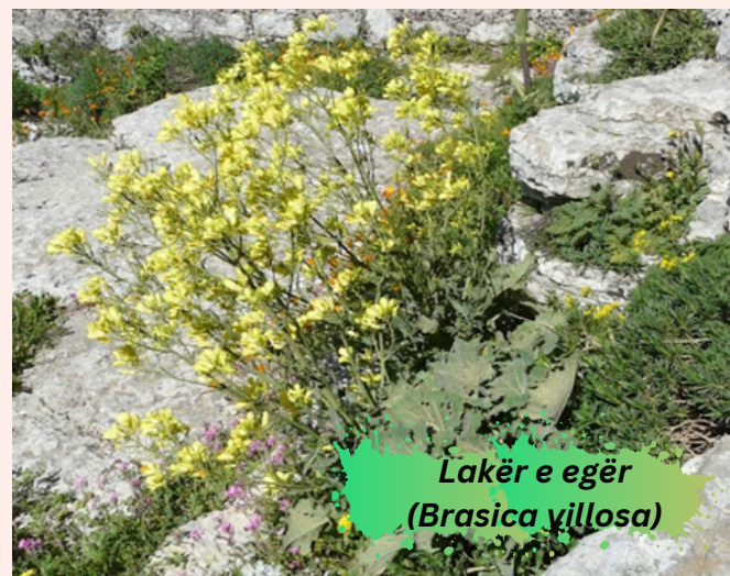
Lakër e egër ( Brasica villosa )