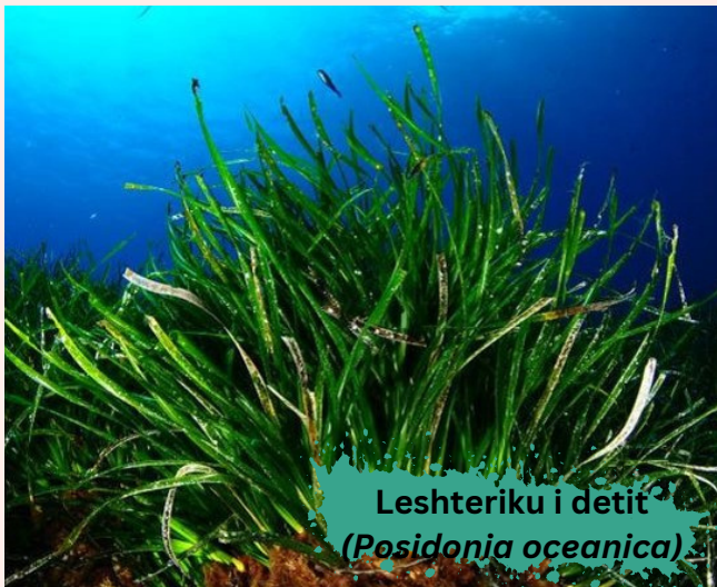
Leshteriku i detit ( Posidonia oceanica )